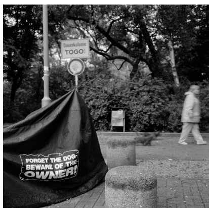
Akinbode Akinbiyi, Wedding, Berlin, 2005, Aus der Serie: „African Quarter“, seit den 1990er Jahren, © Akinbode Akinbiyi