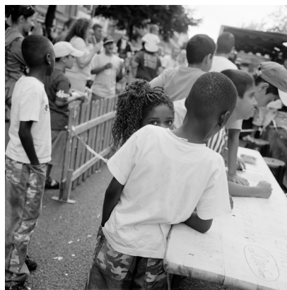
Akinbode Akinbiyi, Wedding, Berlin, 2005, Aus der Serie: „African Quarter“, seit den 1990er Jahren, © Akinbode Akinbiyi

Being, Seeing, Wandering 8.6. – 14.10.24