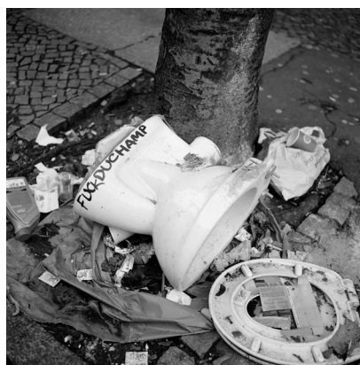
Akinbode Akinbiyi, Neukölln, Berlin, 2019, Aus der Serie: „Photography, Tobacco, Sweets, Condoms and other Configurations“, seit den 1970er Jahren, © Akinbode Akinbiyi