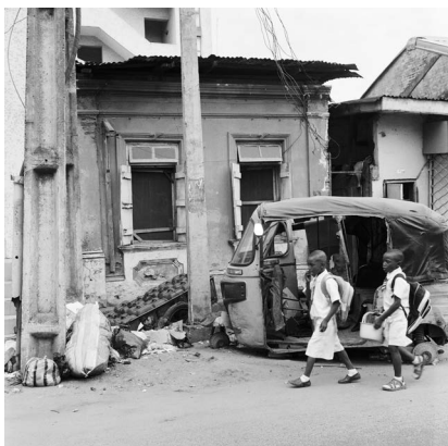
Akinbode Akinbiyi, Lagos Island, Lagos, 2016. Aus der Serie: „Lagos: All Roads“, seit den 1980er Jahren, © Akinbode Akinbiyi