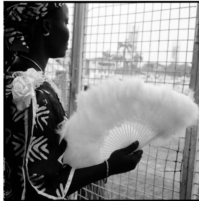
Akinbode Akinbiyi, Lagos Island, Lagos, 2001, © Akinbode Akinbiyi