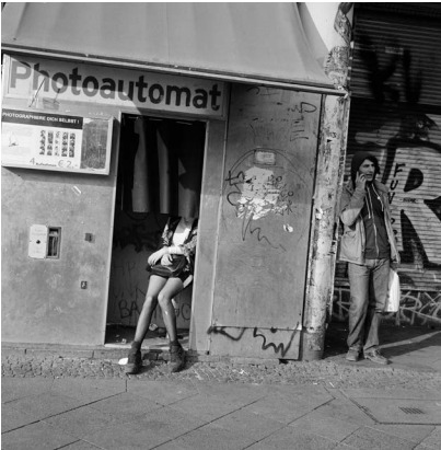
Akinbode Akinbiyi, Kreuzberg, Berlin, 2016. Aus der Serie: „Photography, Tobacco, Sweets, Condoms and other Configurations“, seit den 1970er Jahren