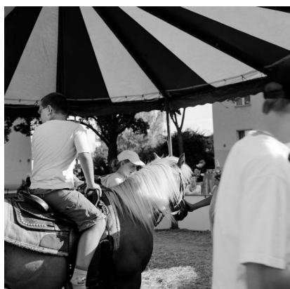
Akinbode Akinbiyi, Wedding, Berlin, 2005, Aus der Serie: „African Quarter“, seit den 1990er Jahren, © Akinbode Akinbiyi