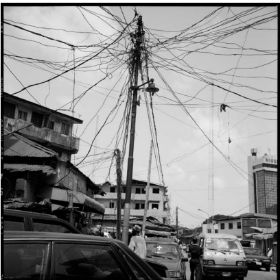
Akinbode Akinbiyi, Popo Aguada, Lagos Island, Lagos, 2006. Aus der Serie: „Lagos: All Roads“, seit den 1980er Jahren, © Akinbode Akinbiyi