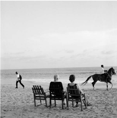
Akinbode Akinbiyi, Bar Beach, Victoria Island, 1999. Aus der Serie: „Sea Never Dry“, seit den 1980er Jahren