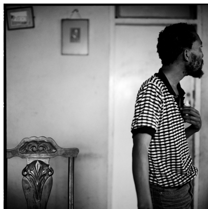
Akinbode Akinbiyi, Durban, 1933, Aus der Serie: „eThekwini“, © Akinbode Akinbiyi