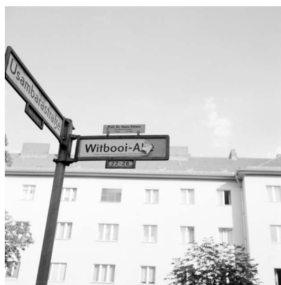
Akinbode Akinbiyi, Wedding, Berlin, 2005, Aus der Serie: „African Quarter“, seit den 1990er Jahren, © Akinbode Akinbiyi