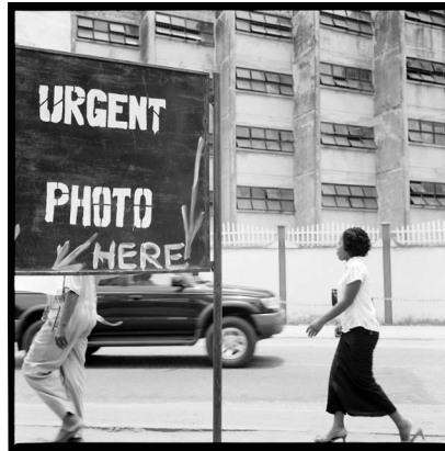
Akinbode Akinbiyi, Victoria Islands, Lagos, 2006. Aus der Serie: „Photography, Tobacco, Sweets, Condoms and other Configurations“, seit den 1970er Jahren